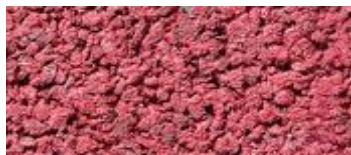
midden rood (..42)