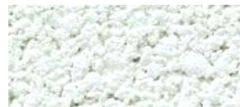
hel wit (..80)