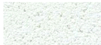
hel wit (..81)