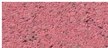
oud rose (..41)