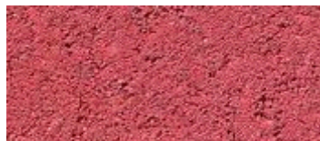
midden rood (..43)